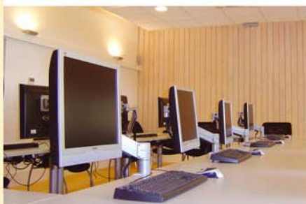
Vue de la salle de formation informatique

La CAFSA a reçu des subventions, du Conseil Régional d'Aquitaine (60 000 €) et du Conseil Général de la Gironde (45 000 €). Le Conseil d'Administration de la CAFSA tient à remercier les collectivités territoriales pour leur participation à des bureaux offrant des conditions de travail optimales à ses collaborateurs.